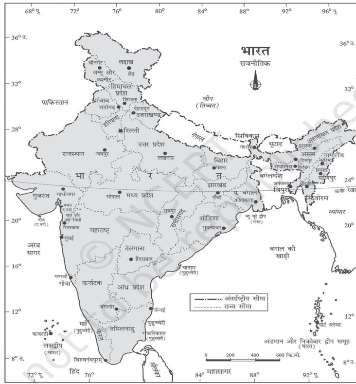
चित्र 1.1 भारत : राजनीतिक