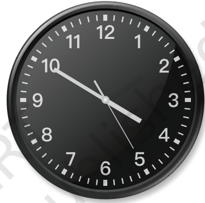
मॉरिशस में घड़ी